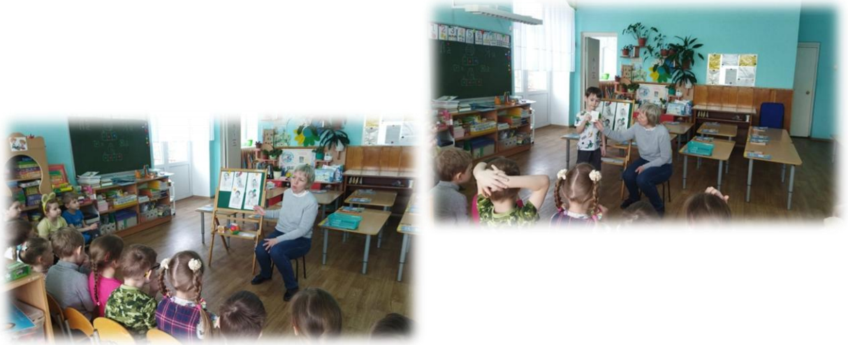
Беседа с детьми «Что такое эмоции»