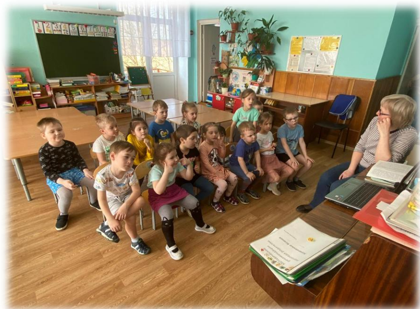
Просмотр презентации «Радуга эмоций»