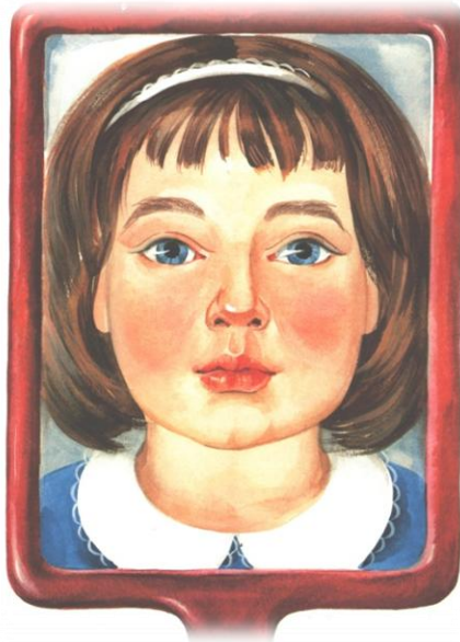
Дидактическая игра «Расколдуй девочку»